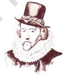
Sir Francis Bacon

Como resultado lamentable, la mayoría de los seres humanos ocupan posiciones ordinarias en la vida, sin ningún intento de lograr lo que de-