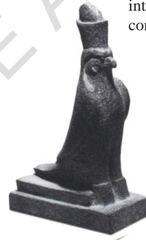
HORUS, “EL HALCÓN”, FUE UNA DEIDAD IMPORTANTE EN LA MITOLOGÍA DINÁSTICA (3500 A. DE C.)